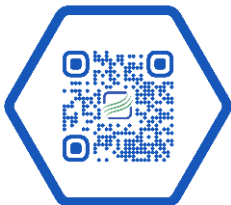
Oficinas Administrativas Ecopetrol