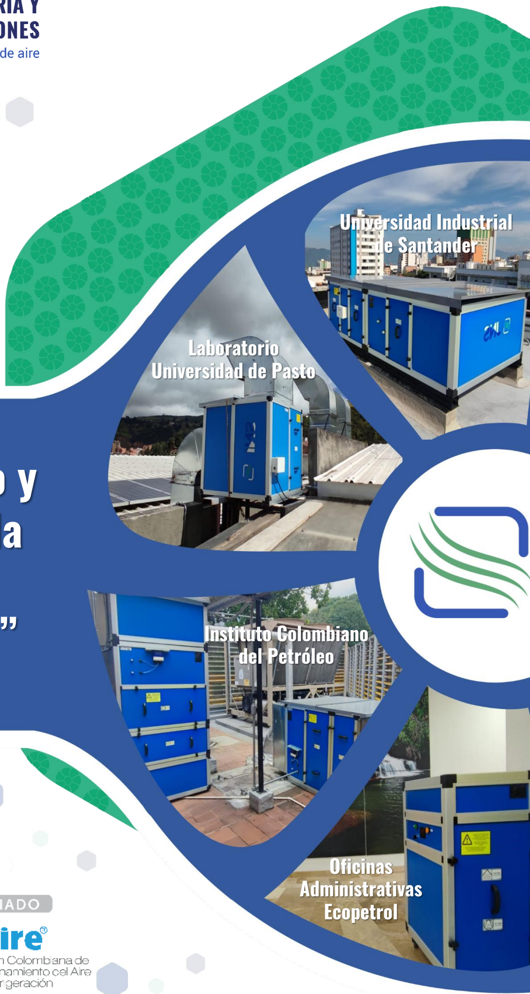
Universidad Industrial de Santander

“Aire tan fresco y puro que solo la naturaleza lo puede superar”